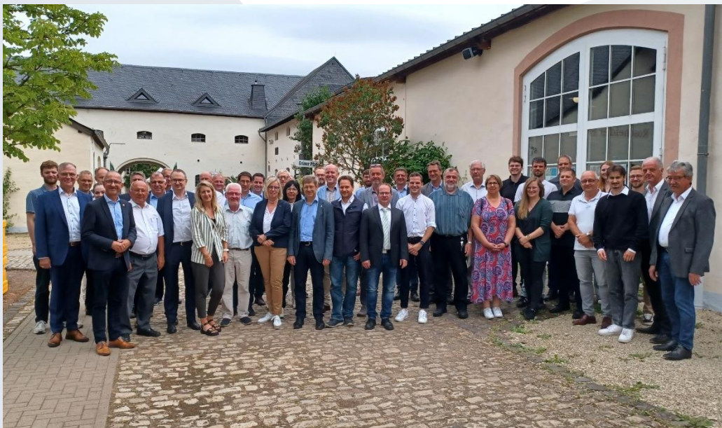
Netzwerk Eifel/Mosel/Hunsrück am 29.06.2023 in Konz

DWA Klare Konzepte. Saubere Umwelt. Landesverband Hessen/Rheinland-Pfalz/Saarland